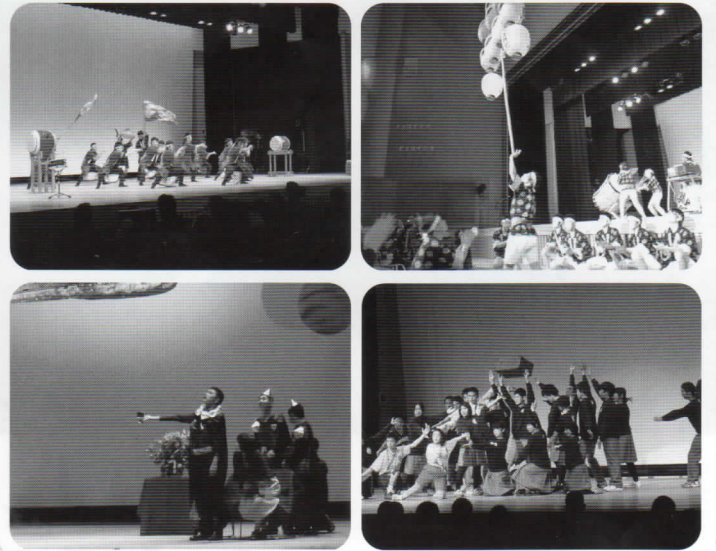
スマイル・ステージ2010より