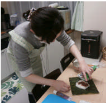
「おにぎらず」 好きな具材を挟めます！