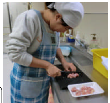
「きりたんぽ鍋」 初めて作りました！