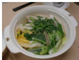
きれいに盛り付け！