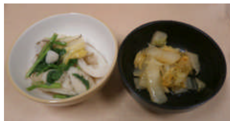
きりたんぽと 白菜のナムル