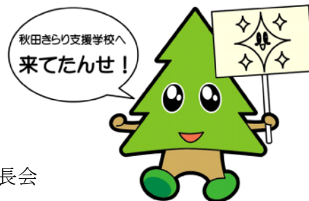
秋田県マスコット スギッチ

後援 文部科学省 秋田県教育委員会 秋田市教育委員会 東北・北海道地区肢体不自由特別支援学校PTA連絡協議会 公益財団法人 日本教育公務員弘済会秋田支部