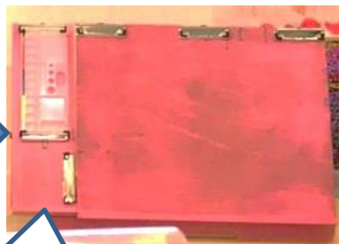
左手(利き手)側にパレット、資料等の固定板を設置