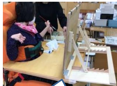
垂直に近い角度にできるように安定性を工夫

新しい書見台は、生徒の見やすさと利き手の可動範囲に合わせて、作業板を垂直近くまで起こすこと、左側（利き手側）に作業スペースを配置し、自分で見本と比べたり、パレットの色を選んで筆につけたりといった自分でできることを増やすことを優先して製作しました。一定時間一人で描画に取り組むなど自分でできることが増えて、自立感と満足感を感じられる形にバージョンアップすることができました。