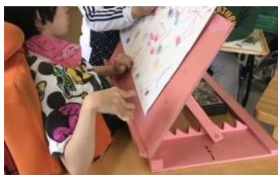
これまでの書見台

今回は、生徒の「一人で書きたい」「自分でやりたい」という意思を尊重して、書見台をバージョンアップした事例を紹介します。