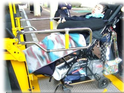
スクールバスでの校外学習

医療的ケアが必要な児童生徒がスクールバスを利用した校外学習に参加できるよう、学校看護職員が同行するための体制を整えています。「校内検討会」を設定し、安全な実施に努めています。